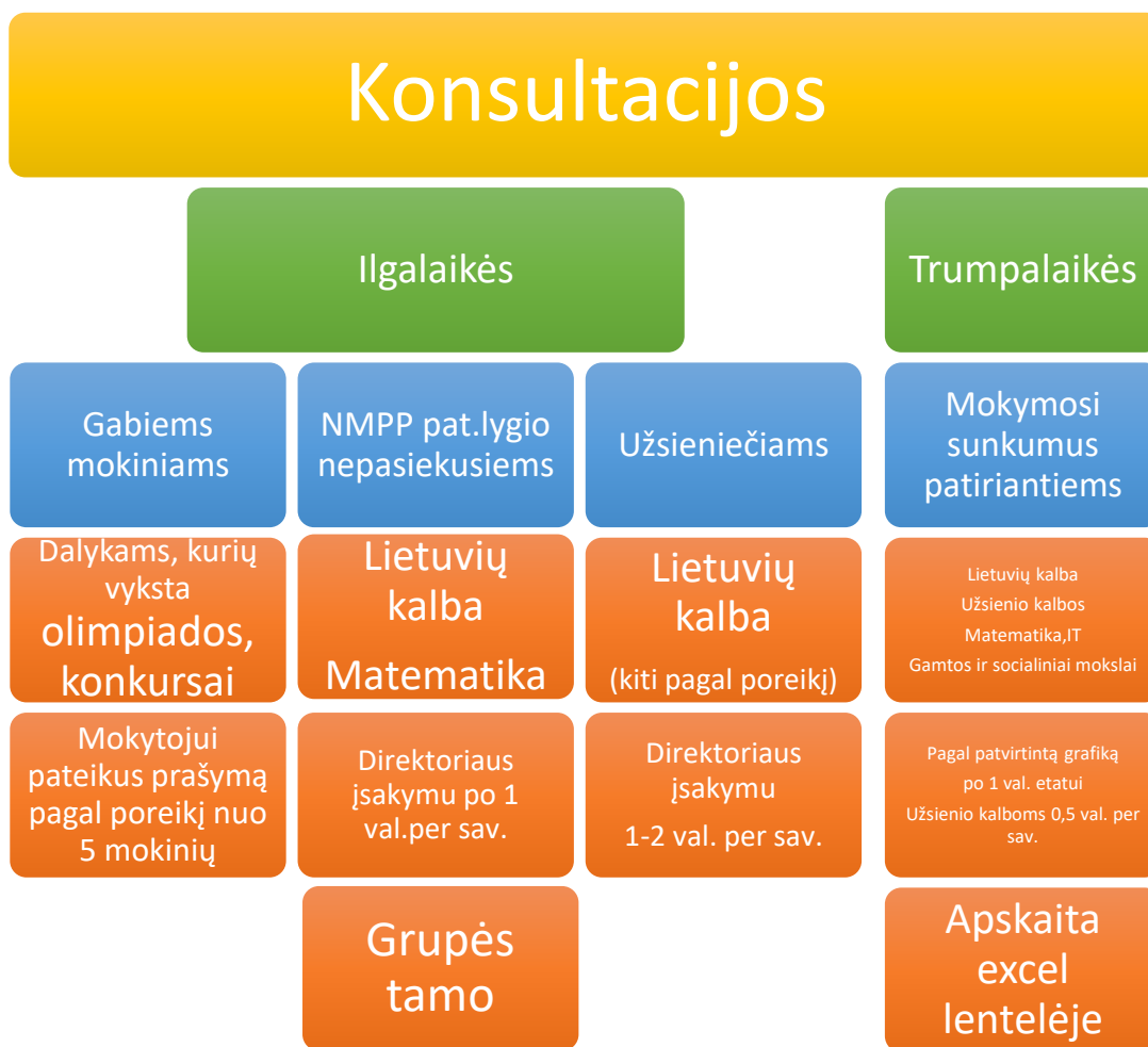
2 pav. Konsultacijų organizavimo schema.

37. Visa konsultacijų schema pateikiama 2 paveiksle.