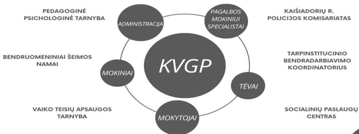
2 pav.. Įtraukiojo ugdymo Kaišiadorių Vaclovo Giržado progimnazijoje įgyvendinimo schema.

Siekiant užtikrinti kokybišką ugdymąsi kiekvienam mokiniui, ypatingai didelis dėmesys yra skiriamas Progimnazijos specialistų, administracijos, mokytojų bendradarbiavimui su socialiniais partneriais. Bendradarbiavimo schema įgyvendinant įtraukijį ugdymą pavaizduota 2 paveiksle.